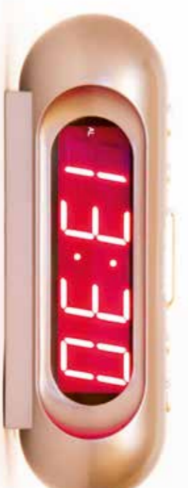
une heure et demie de l'après-midi.