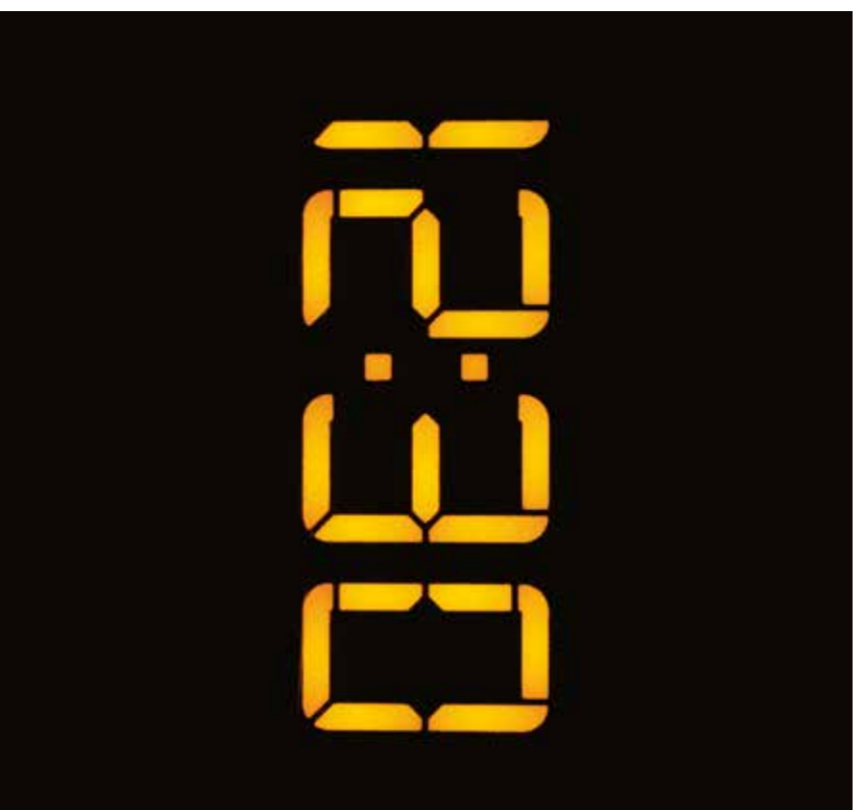
midi et demi.