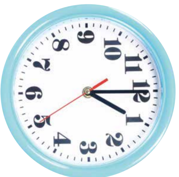
une heure de l'après-midi.