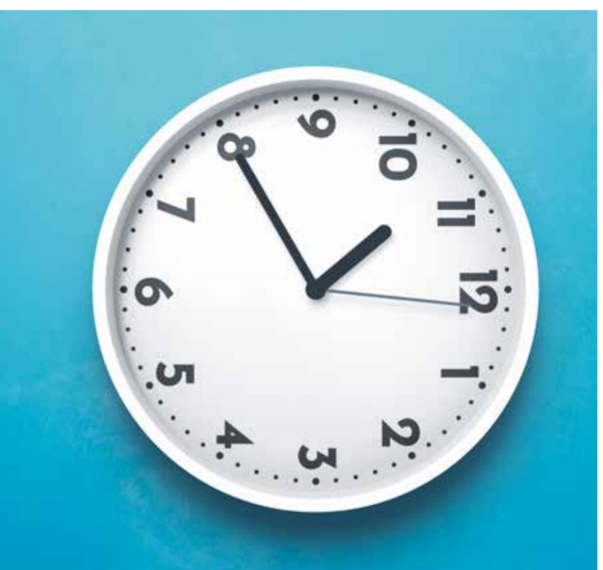
onze heures moins vingt du matin.